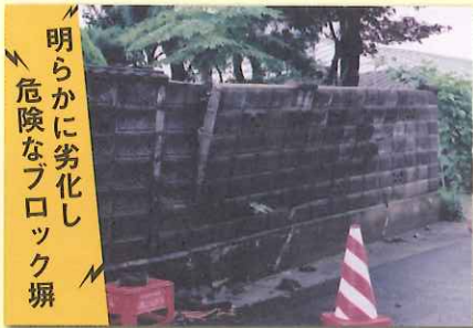
明らかに劣化し 危険なブロック塀