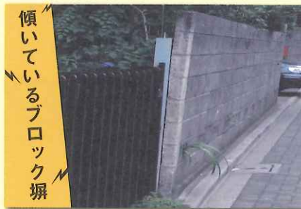
傾いているブロック塀