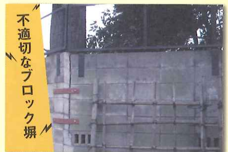
不適切なブロック塀

こんな症状があると、震災時に転倒や倒壊の恐れがあります。人が死傷したり、救急活動・物資供給の妨げになります。専門家に相談の上、早めの対策をしましょう。