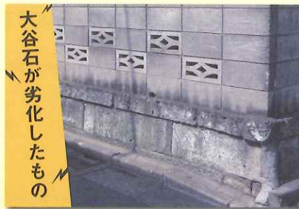
大谷石が劣化したもの